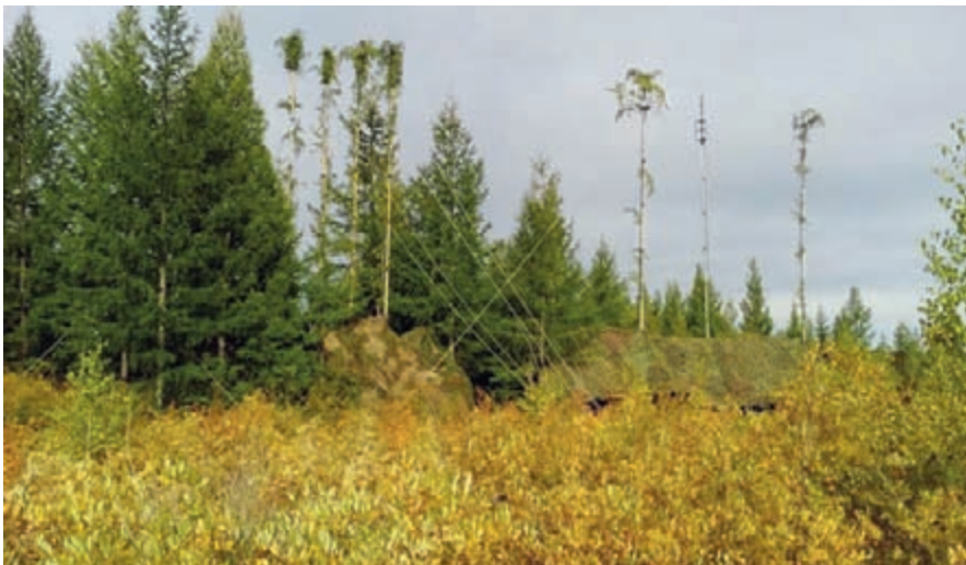
Маскировка позиции станции помех Р-330Ж