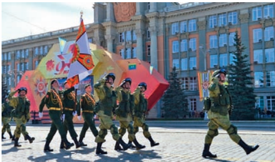
9 мая, бригада РЭБ

Особое внимание уделялось командно-штабному учению с вооруженными силами Республики Таджикистан в марте 2016 года. В рамках стратегического сдерживания, демонстрируя решимость применения средств РЭБ, комплексом радиопомех «Мурманск-БН» из состава соединения РЭБ военного округа успешно выполнены задачи по радиоподавлению радиоэлектронных средств условного противника на территории союзных государств. Показали высокую эффективность и маневренные группы РЭБ 201 военной