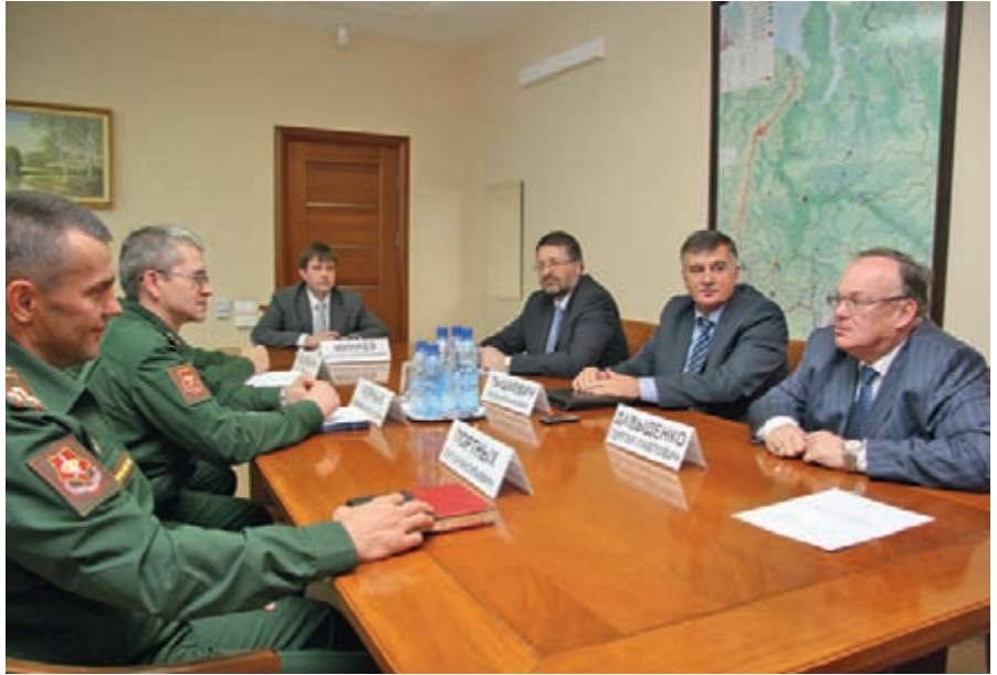
Рабочая встреча в филиале ФГУП РЧЦ ЦФО в УФО

В летнем периоде обучения проведен лагерный сбор частей и подразделений РЭБ округа. Мероприятие проведено на пяти полигонах под руководством начальников служб РЭБ объединений. Перед его началом все подразделения успешно прошли мероприятия входного контроля в форме контрольных занятий. В период про-