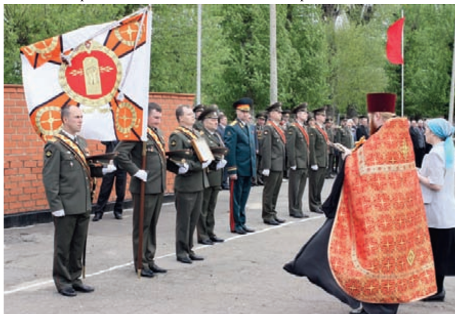
Ритуал вручения и освящения Боевого знамени

годно на его базе проводятся сборы руководящего состава органов военного управления РЭБ ВС РФ, сборы с командирами соединений, воинских