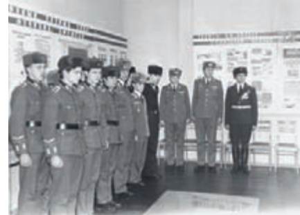
Обучение в центре первых иностранных военнослужащих из ГДР