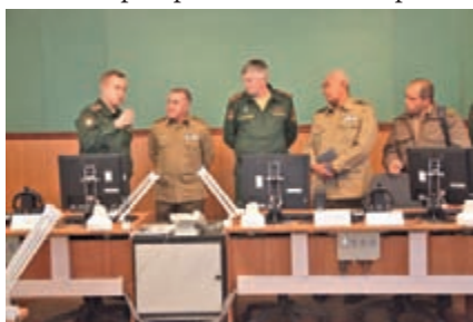
Визит кубинской делегации во главе с начальником Управления РЭБ РВС Республики Куба бригадным генералом Э. Паламино

практическую стажировку на комплексах РЭБ более 250 иностранных военнослужащих — слушателей военных академий МО РФ из таких стран, как КНДР, Ливия, Югославия, Индия, Алжир, Китай, Эфиопия.