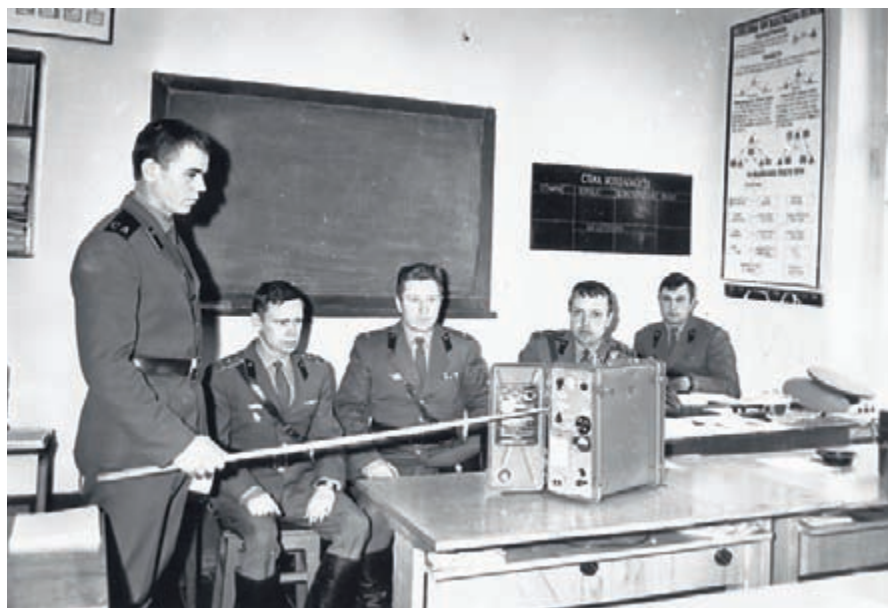
Экзамен по специальной подготовке, г. Урюпинск 1974 г.

В Центре ведётся настойчивая работа над совершенствованием учебно-воспитательного процесса. На его базе осуществляется обучение специали-