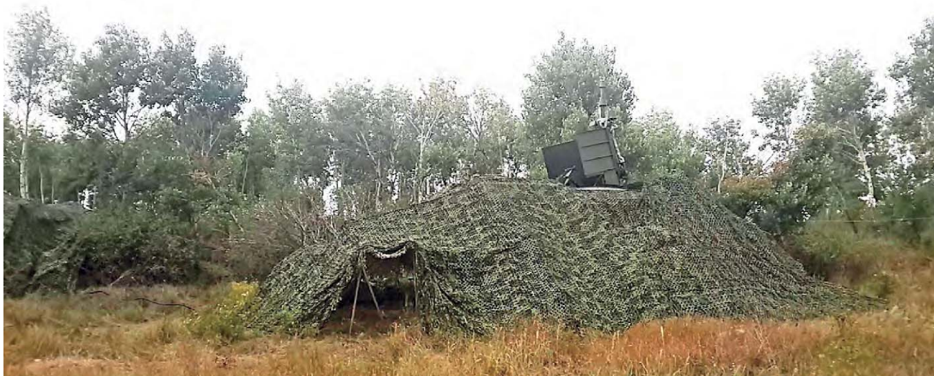
Станция КРТР на Тоцком полигоне

татом которого соединение оценено на «ХОРОШО».