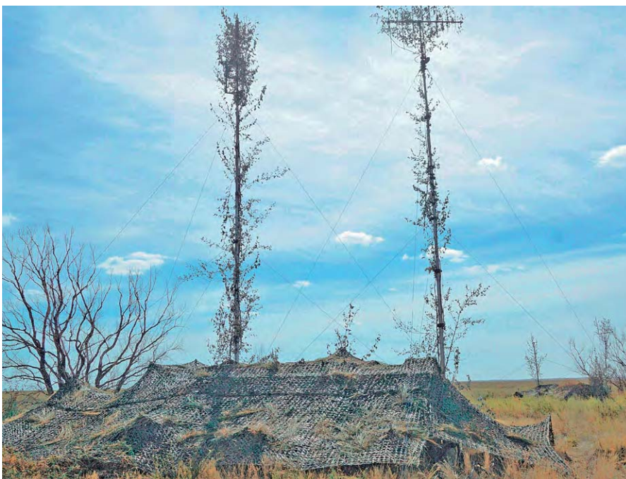
Станция Р-934 Б на позиции

Коллектив соединения РЭБ Центрального военного округа продолжает выполнять учебные и специальные задачи. Многого предстоит сделать по повышению уровня боевой готовности, боевой подготовки, воинской дисциплины и совершенствованию объектов части, но в настоящее время можно с уверенностью сказать: «Рэбовцы» Урала Родину не подведут! С честью выполняют любую поставленную перед ними задачу!