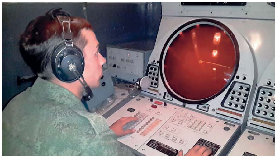
Выполнение нормативов и задач

Основное внимание командование уделяет боевой подготовке, справедливо считая, что боевая подготовка — основа повседневной деятель-