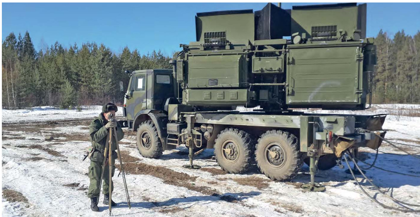
Ориентирование станции помех

ности части. В 2015 году подготовка личного состава была направлена на достижение главной цели — успешного выполнения задач в ходе СКШУ «Центр-2015». Поэтому основной упор делался на совершенствование полевой выучки личного состава. Впервые в истории части в зимнем периоде обучения в течение месяца проведен полевой выход без опоры на казарменно-жилищный фонд. На Свердловском учебном центре своими силами был оборудован благоустроенный полевой лагерь, который позволил организовать подготовку личного состава с комфортом в непростых условиях суровой уральской зимы. В ходе полевого выхода отработаны вопросы слаживания взводов и рот, основное внимание уделялось практической работе на технике.