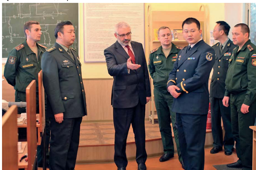
Визит делегации КНР

В течение 2015 года на базе специального отделения центра велась подготовка национальных военных кадров и технического персонала иностранных государств. Офицеры из Китайской Народной Республики, Алжирской Народной Демократической Республики, Республики Армения с благодарностью оценили организацию обучения, проживания и досуга в стенах цен-