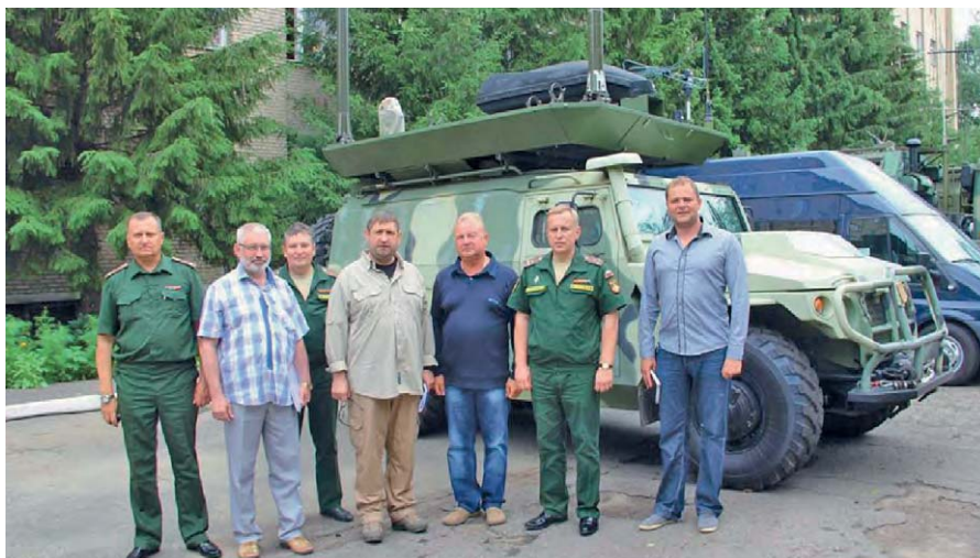
Специальный корреспондент телеканала «Россия» А. Сладков в центре

С благодарностью оцениваю напряженную работу, проделанную коллективом центра в 2015 году. Высокие профессиональные качества офицеров, военнослужащих контрактной службы, гражданского персонала, их морально-психологическая готовность позволяют уверенно сказать: задачи, возложенные на Межвидовой центр подготовки и боевого применения войск РЭБ (учебный и испытательный) и впредь будут выполняться с максимальным качеством.