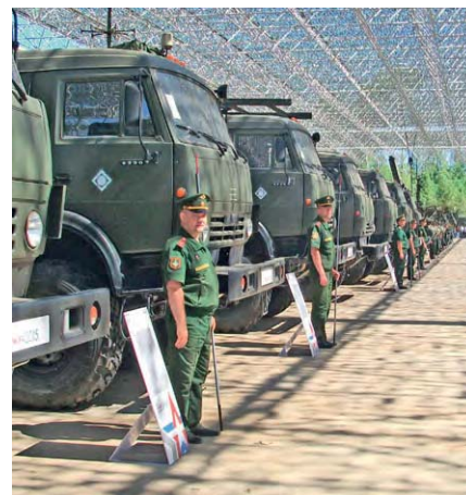
Показ техники РЭБ на форуме «Армия –2015»

В августе-сентябре в г. Тамбове лучшие экипажи и офицеры воинских частей и подразделений РЭБ