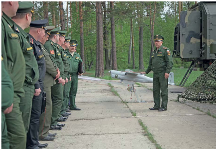
Мероприятия в рамках сбора