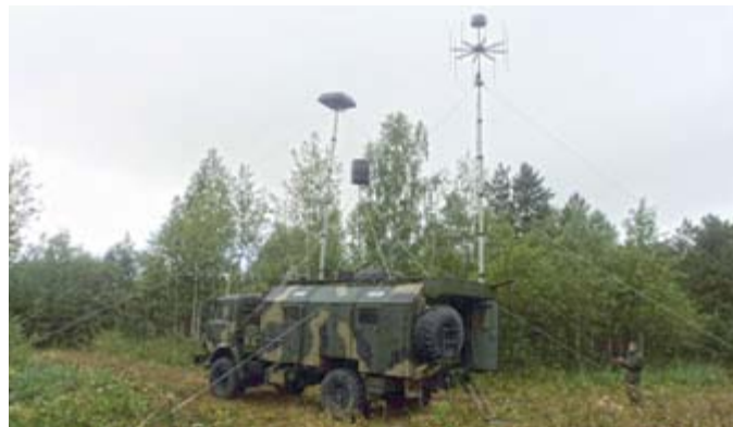
Техника ЦКУ на позициях

командного пункта войсковой части 63562 (город Екатеринбург), в короткие сроки был назначен командиром взвода радиопомех (УКВ-радиосвязи) роты радиопомех войсковой части 63562. Молодой офицер быстро освоил средства радиоэлектронной борьбы. Основные задачи его службы заключались в умелом развертывании станций радиопомех, обнаружении и подавлении радиосигналов противника и поддержании связи между своими подразделениями.