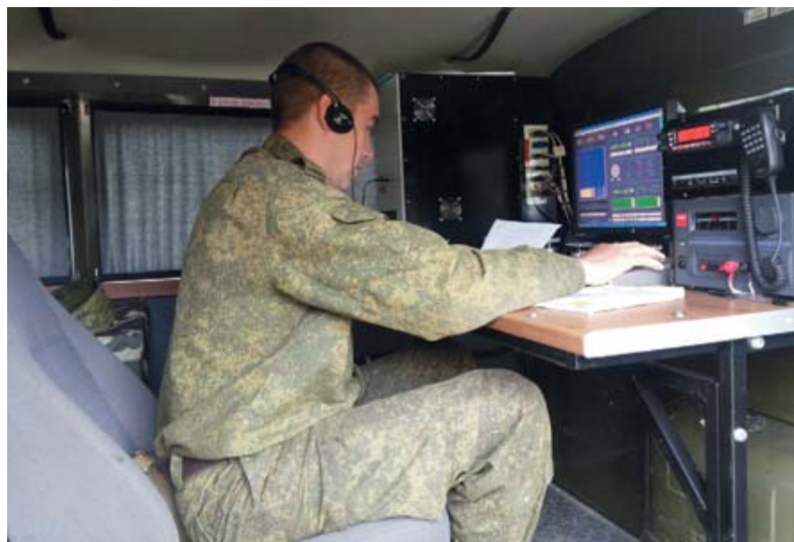
Занятия на технике